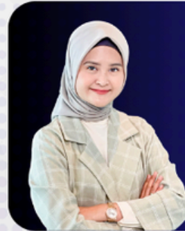
NUR AINSYAH OKTAVIA ANTIGEN DAN AUTOANTIBODI PADA AUTOIMUN MIOSITIS